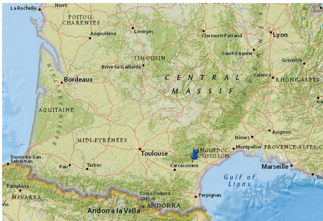
Рисунок 1. Карта расположения пещеры Биз Figure 1. Map of Bize cave location

выставки Дмитрий Николаевич проводил сбор материалов и осмотр доисторических памятников Франции. На некоторых пещерных стоянках ему посчастливилось провести небольшие изыскания под руководством своих французских коллег. Одной из таких стоянок стала пещера Биз. Летом 1878 г. Д.Н. Анучин в сопровождении Э. Картальяка посетил пещеру и произвёл трёхдневные раскопки, результатом которой стала небольшая коллекция, ныне хранящаяся в фонде археологии НИИ и Музея антропологии МГУ имени М.В. Ломоносова. Учёные проследили последовательность отложений, слагающих заполнение пещеры: