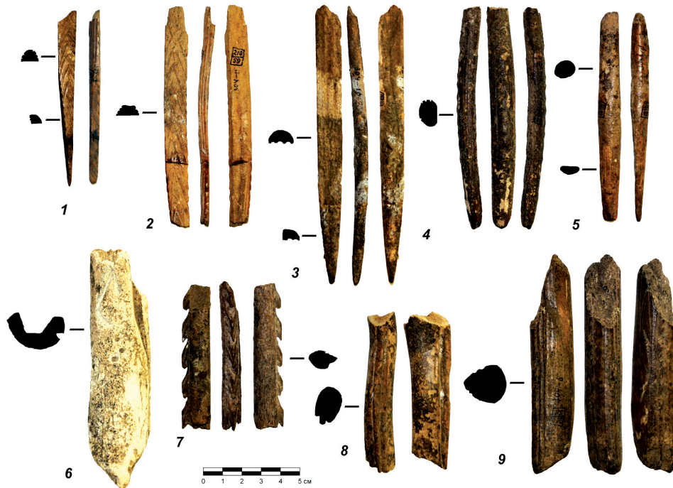
Рисунок 4. Орудия и поделки из рога северного оленя из палеолитической коллекции из пещеры Биз (Франция) Figure 4. Antler tools and pieces in the Paleolithic collection from Bize cave (France)

Примечания. 1 – наконечник со скошенным с двух сторон основанием (инв. № 210/51); 2 – удлиненная поделка (инв. № 210/59); 3 – наконечник на полукруглой в сечении заготовке (инв. № 210/50); 4 – полукруглый стержень (инв. № 210/57); 5 – наконечник со скошенным основанием (инв. № 210/48); 6 – фрагмент рога северного оленя (инв. № 210/61); 7 – односторонний гарпун (инв. № 210/60); 8 – стержень (инв. № 210/58); 9 – обломок рога с двумя продольными пазами (инв. № 210/63).